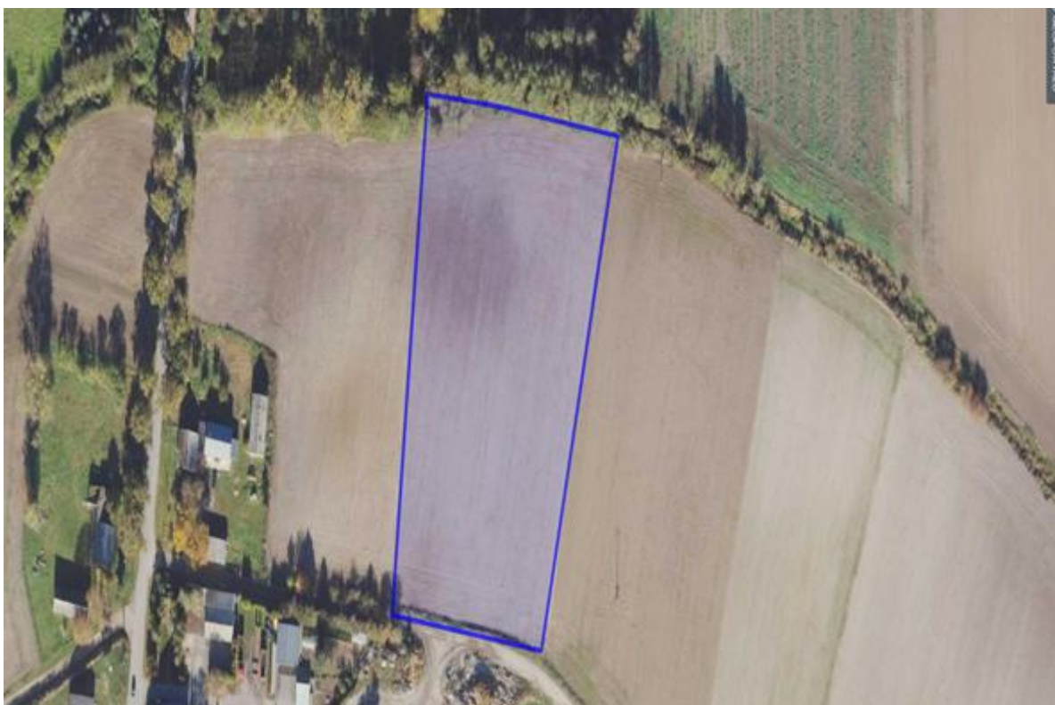
7) Działka numer 61/2 obręb Słupowa.