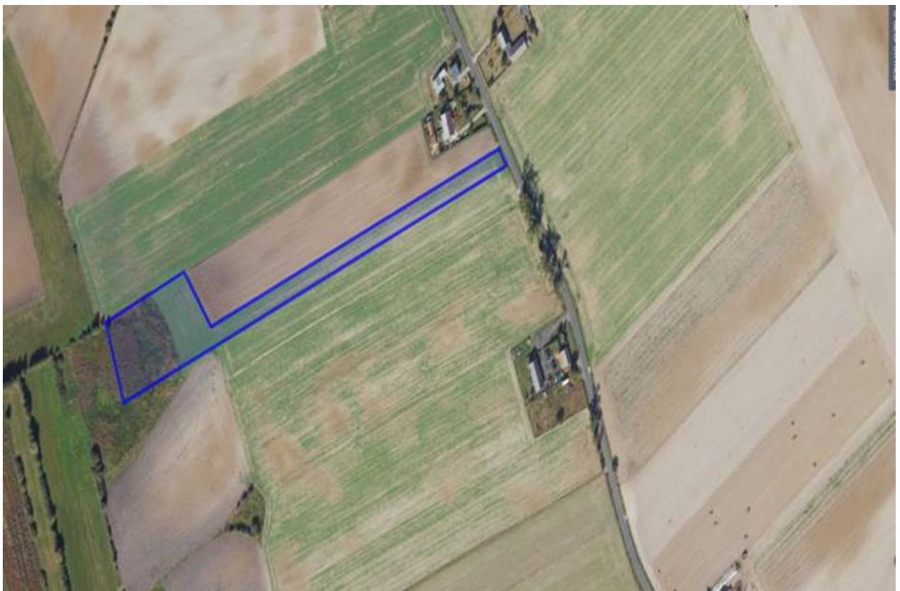
5) Działka numer 91 obręb Górki Zagajne.