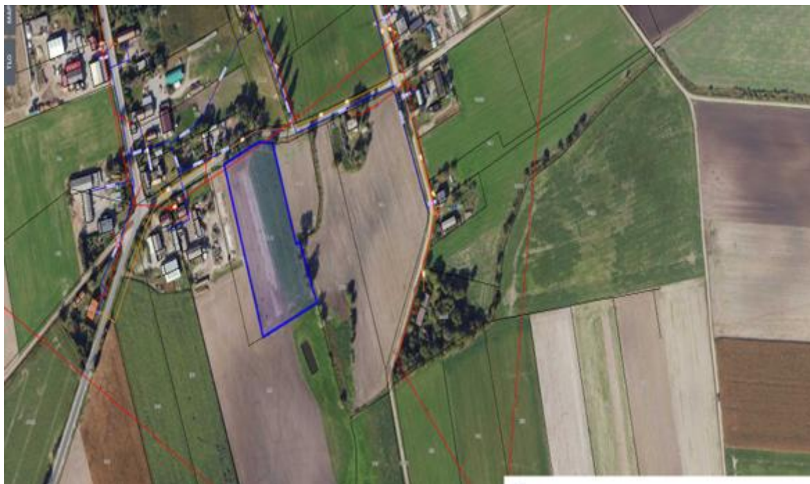
10) Działka numer 517/29 obręb Kcynia.