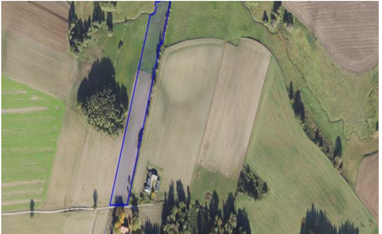
8) Działka numer 141/1 obręb Turzyn.