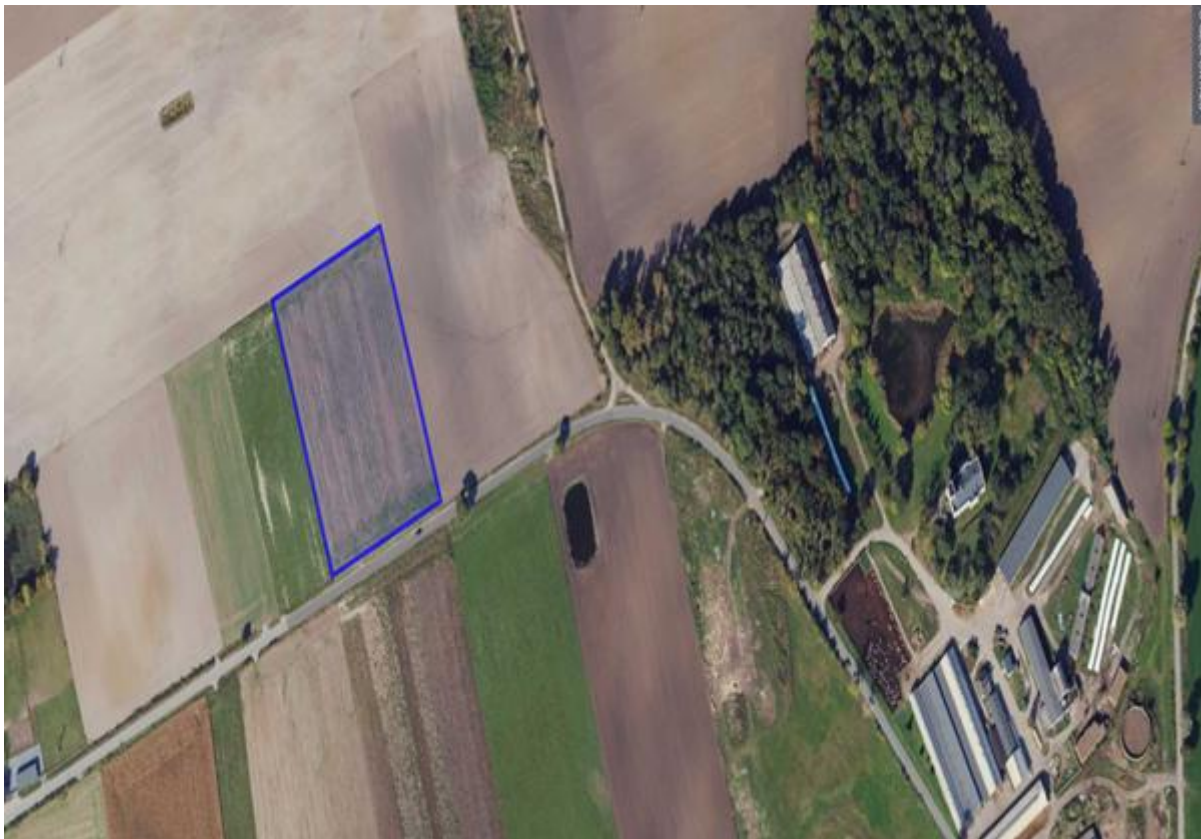
6) Działka numer 81 obręb Iwno.