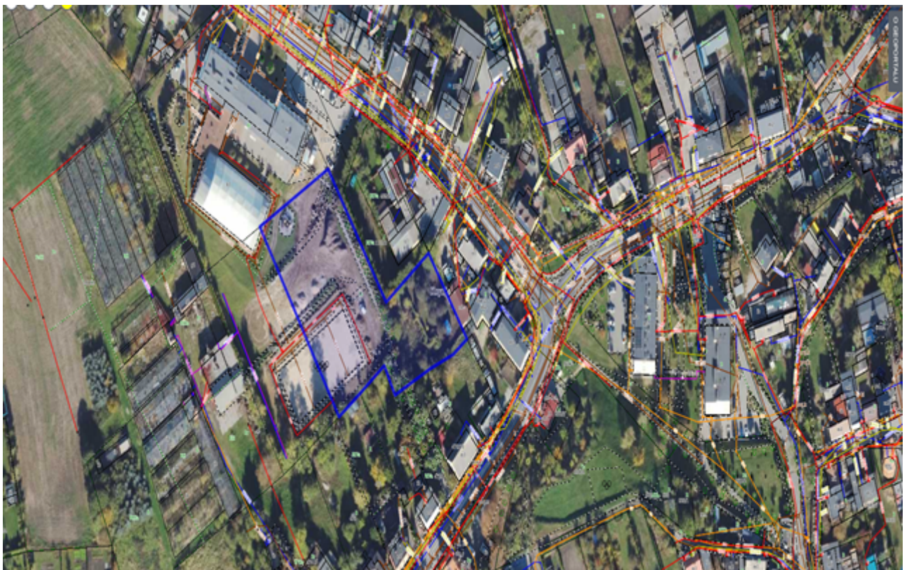
5) Działka numer 13/18 obręb Głogowiniec.