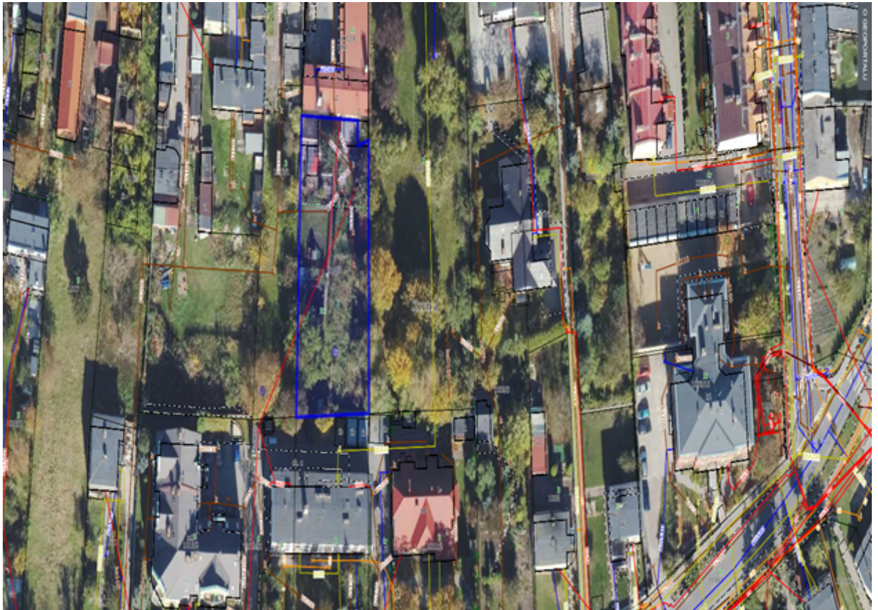
4. Działka numer 470/3 obręb Kcynia.