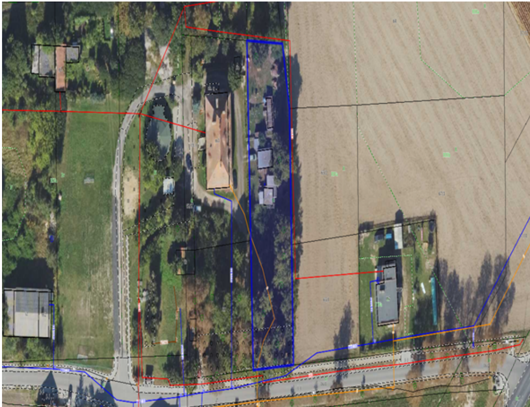
6) Działka numer 98/3 obręb Dobieszewo.